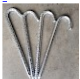
Piquets d'ANCORAGE 50