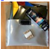
Kit REPARATIONS Structures Gonflables d ASG34