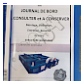
DOSSIER de Conformités & NOTICE d'Utilisation