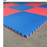
DALLE de RÉCEPTION CLIPSABLE 2.6