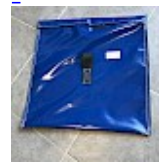
SAC de LEST Pour Structure Gonflable