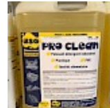
PRO CLEAN Nettoyant Spécial PVC