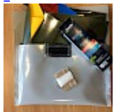
Kit REPARATIONS Structures Gonflables d ASG34