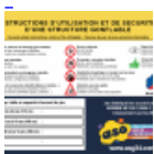
Panneau de SECURITE en 3 langues