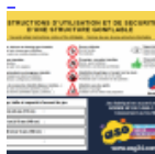
AFFICHAGE de SECURITE en 3 langues