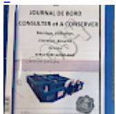
DOSSIER de Conformités & NOTICE d'Utilisation