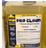
PRO CLEAN Nettoyant Spécial PVC