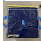
SAC de LEST Pour Structure Gonflable NEW!