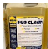
PRO CLEAN Nettoyant Spécial PVC