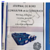
DOSSIER de Conformités & NOTICE d'Utilisation