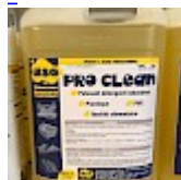
PRO CLEAN Nettoyant Spécial PVC