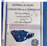
DOSSIER de Conformités & NOTICE d'Utilisation