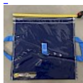
SAC de LEST Pour Structure Gonflable NEW!