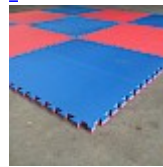
DALLE de RÉCEPTION CLIPSABLE 2.6