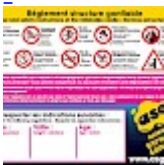
Panneau de SECURITE