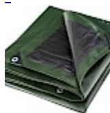
BACHE DE PROTECTION 5x8m pour Structure Gonflable 240g/m²