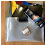
Kit REPARATIONS Structures Gonflables d ASG34