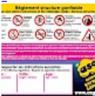
Panneau de SECURITE