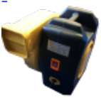
SOUFFLERIE/BLOWER Normes CE - 220v/16a - IP44 (nombre et puissance adaptée au jeu)