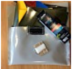
Kit REPARATIONS Structures Gonflables d ASG34