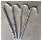
Piquets d'ANCRAGE 50