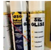
Lubrifiant Bombe pour la Glisse