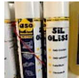
Lubrifiant Bombe pour la Glisse