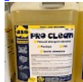
PRO CLEAN Nettoyant Spécial PVC