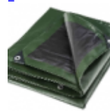
BACHE DE PROTECTION Pour Structure Gonflable 6/10/240grm 2