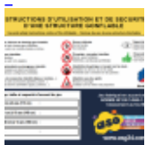
Panneau de SECURITE en 3 langues