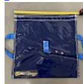
SAC de LEST Pour Structure Gonflable NEW!