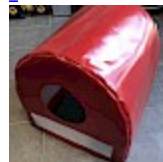
CAISSON de Protection SOUPLE pour soufflerie