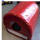
CAISSON de Protection SOUPLE pour soufflerie