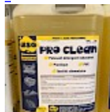
PRO CLEAN Nettoyant Spécial PVC