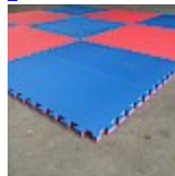
DALLE de RÉCEPTION CLIPSABLE 2.6