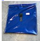
SAC de LEST Pour Structure Gonflable