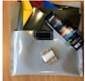
Kit REPARATIONS Structures Gonflables d ASG34