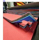
DALLE TAPIS de RÉCEPTION CLIPSABLE 2.1