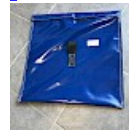
SAC de LEST Pour Structure Gonflable