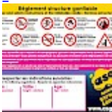
Panneau de SECURITE