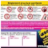
Panneau de SECURITE