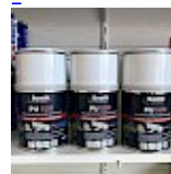
COLLE pour structure & chateau gonflable Bostik Pro PU 520