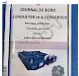
DOSSIER de Conformités & NOTICE d'Utilisation