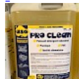
PRO CLEAN Nettoyant Spécial PVC