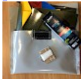
Kit REPARATIONS Structures Gonflables d'ASG34