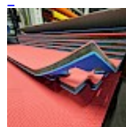
DALLE TAPIS de RÉCEPTION CLIPSABLE 2.1