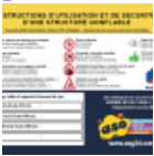
Panneau de SECURITE en 3 langues