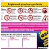
Panneau de SECURITE