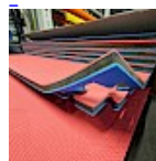
DALLE TAPIS de RÉCEPTION CLIPSABLE 2.1