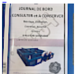
DOSSIER de Conformités & NOTICE d'Utilisation