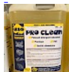
PRO CLEAN Nettoyant Spécial PVC