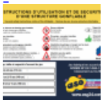
Panneau de SECURITE en 3 langues