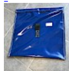
SAC de LEST Pour Structure Gonflable