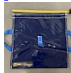
SAC de LEST Pour Structure Gonflable NEW!