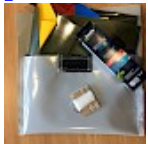
Kit REPARATIONS Structures Gonflables d ASG34