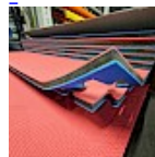
DALLE TAPIS de RÉCEPTION CLIPSABLE 2.1