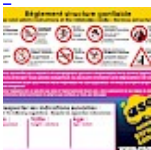
Panneau de SECURITE