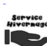
SERVICE ASG Hivernage Maintenance SAV