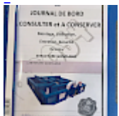
DOSSIER de Conformités & NOTICE d'Utilisation