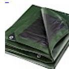
BACHE DE PROTECTION 5x8m pour Structure Gonflable 240g/m 2