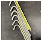
Crosses, Piquets d'ANCORAGE 42 cm