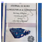
DOSSIER de Conformités & NOTICE d'Utilisation