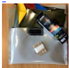
Kit REPARATIONS Structures Gonflables d ASG34