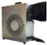
SOUFFLERIE/BLOWER Normes CE (nombre et puissance adaptée au jeu)