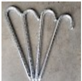
Piquets d'ANCORAGE 50