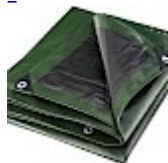
BACHE DE PROTECTION pour Structure Gonflable 15x10 240g/m 2