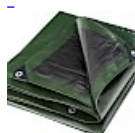
BACHE DE PROTECTION Pour Structure Gonflable 5x8 240g/m 2