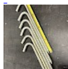
Crosses, Piquets d'ANCORAGE 42 cm