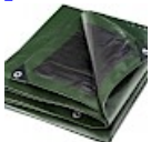
BACHE DE PROTECTION 5x8m pour Structure Gonflable 240g/m 2