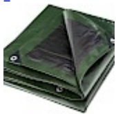
BACHE DE PROTECTION 5x8m pour Structure Gonflable 240g/m 2