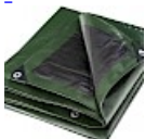
BACHE DE PROTECTION 4x5m pour Structure Gonflable 240 g/m 2