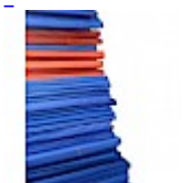
TAPIS de Réception pour jeu gonflable