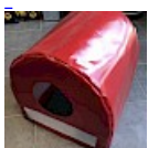
CAISSON de Protection SOUPLE pour soufflerie